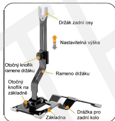
Části a funkce