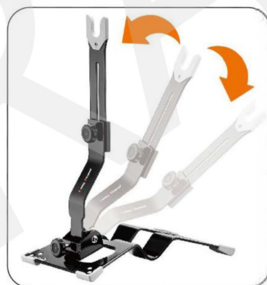
Sklopení ramene držáku